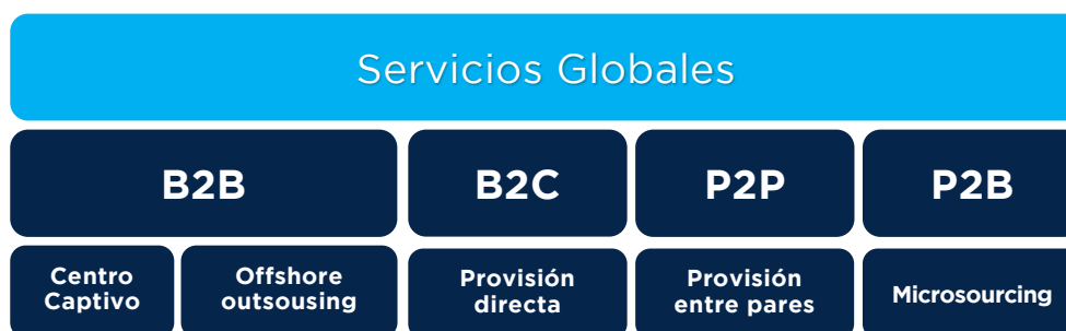
Figura 1 Modelo de provisión de servicios globales