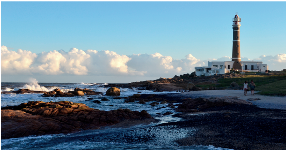
Fotos: Cabo Polonio, Rocha

En contraste con esta vasta naturaleza agreste, se despliegan modernas construcciones urbanas, donde conviven estilos coloniales, clásicos y Art Nouveau. Montevideo, capital del país, se destaca como una de las mejores ciudades del mundo para apreciar el estilo Art Decó y recrear diferentes épocas en sus variados escenarios. La versatilidad que ofrece Uruguay permite a su vez simular lugares muy diversos como la Habana Vieja, París, Londres, el Caribe, Río de Janeiro, Italia, Irlanda o Berlín, entre otros.