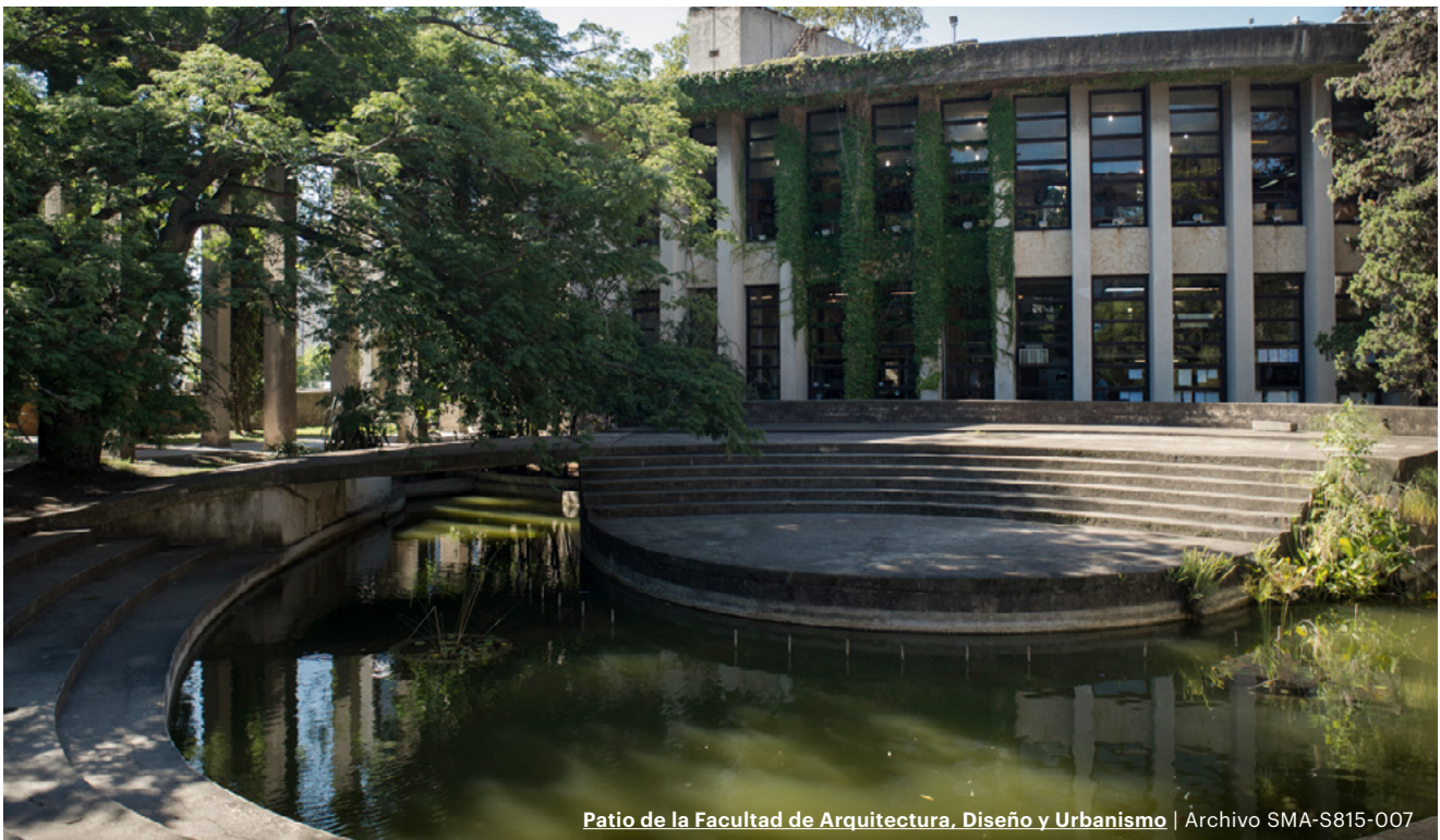
Patio de la Facultad de Arquitectura, Diseño y Urbanismo

“Mi primer viaje a Uruguay me abrió los ojos. No tenía ni idea de que este pequeño país tuviera tanto que ofrecer. Por las impresionantes universidades, el espíritu empresarial, y la magnífica costa, está claro que Uruguay está listo para dar un paso en el escenario mundial”.