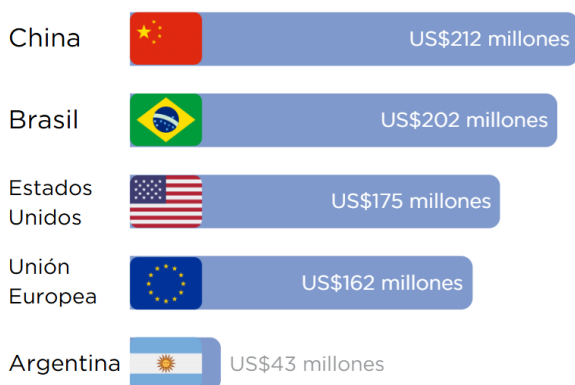
Gráfico N°2 Principales destinos de exportación Millones US$