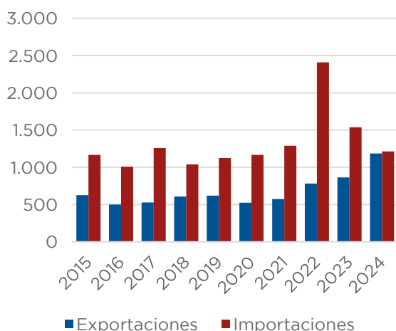
Gráfico N°3 Balanza comercial de bienes Exportaciones e Importaciones Millones de US$