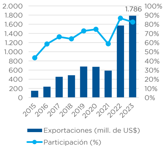
Gráfico N°4 Exportaciones servicios TI a Estados Unidos Millones US$ y Part. %

Nota: Incluyen las ventas realizadas a través de filiales de empresas uruguayas en el exterior.